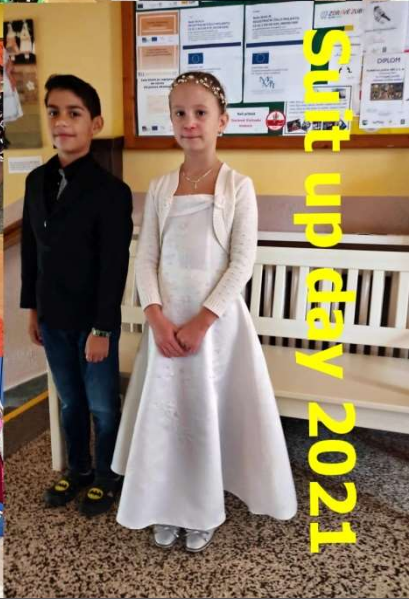
Stift up day 2021