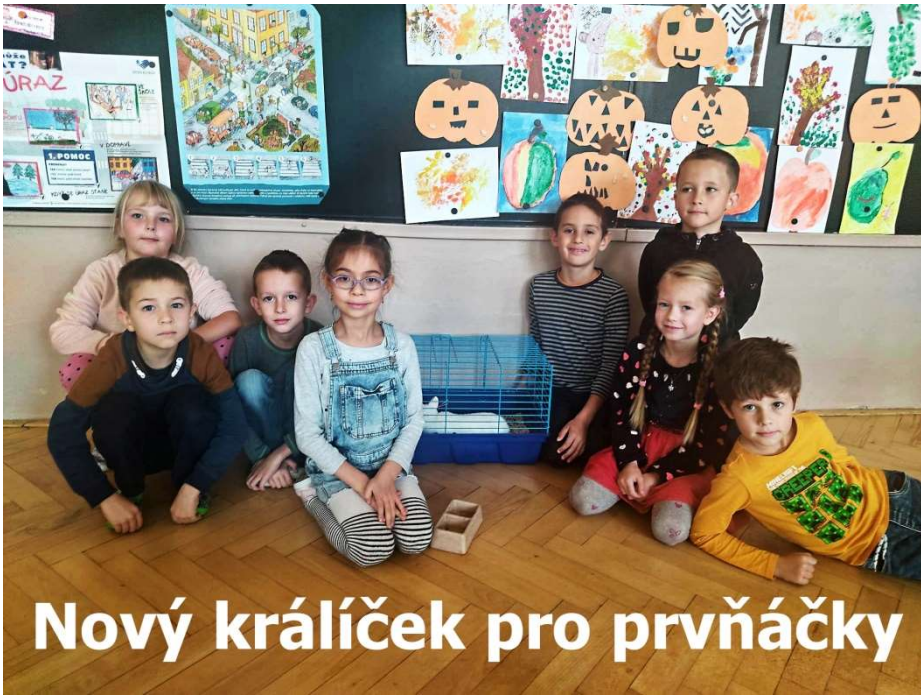
Nový králíček pro prvňáčky